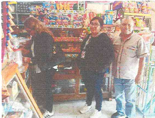
SUPERVISION LOCAL COMERCIAL PARA LIBERACION DE LICENCIA ATRAVES DE CABILDO