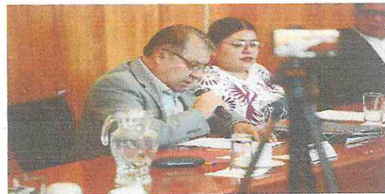
AUTORIZACION DE LICENCIAS COMERCIALES ATRAVES DE CABILDO

EL EQUIPO DE TRABAJO QUE SON DE OFICINA LAS Y LOS COMPAÑEROS SUPERVISORES REALIZAN SUS ACTIVIDADES DE MANERA EFICIENTE Y EL PERSONAL DE DICHA AREA ES INSUFICIENTE PARA ABARCAR LAS 47 COMUNIDADES DE NUESTRO MUNICIPIO DE MANERA GENERAL, LO RECORN EN MUCHAS OCASIONES CAMINANDO GRANDES DISTANCIAS EN ALGUNAS COMUNIDADES GRANDES, LO QUE DIFICULTA QUE SEAN EFICIENTES. EN OTRAS CON TRANSPORTE OFICIAL DE ACUERDO A LAS CARACTERISTICAS DE LAS COMUNIDADES A VISITAR.