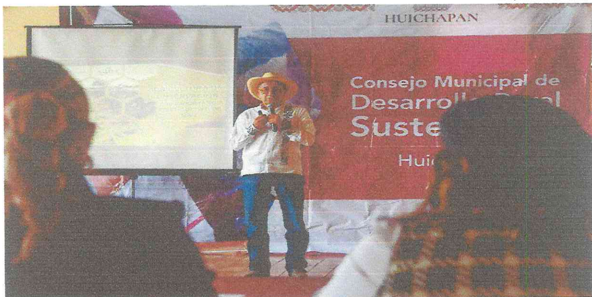
UNA DE LAS DOS SESIONES DEL CONSEJO MUNICIPAL DE DESARROLLO SUSTENTABLE.