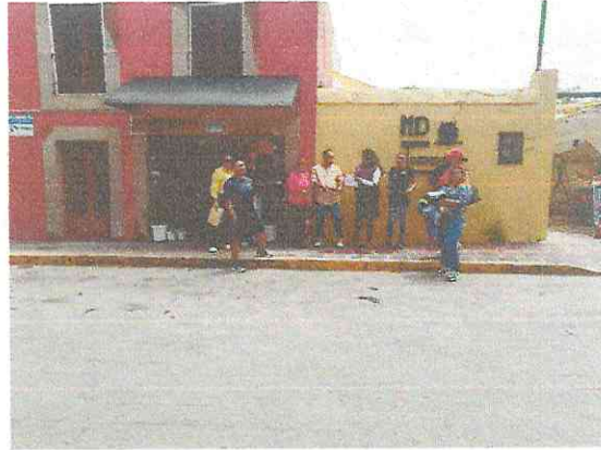
SUPERVISION A NEGOCIOS POR PARTE DEL AREA DE REGLAMENTOS Y REGIDOR PRESIDENTE DE LA COMISION DE COMERCIO Y ABASTO