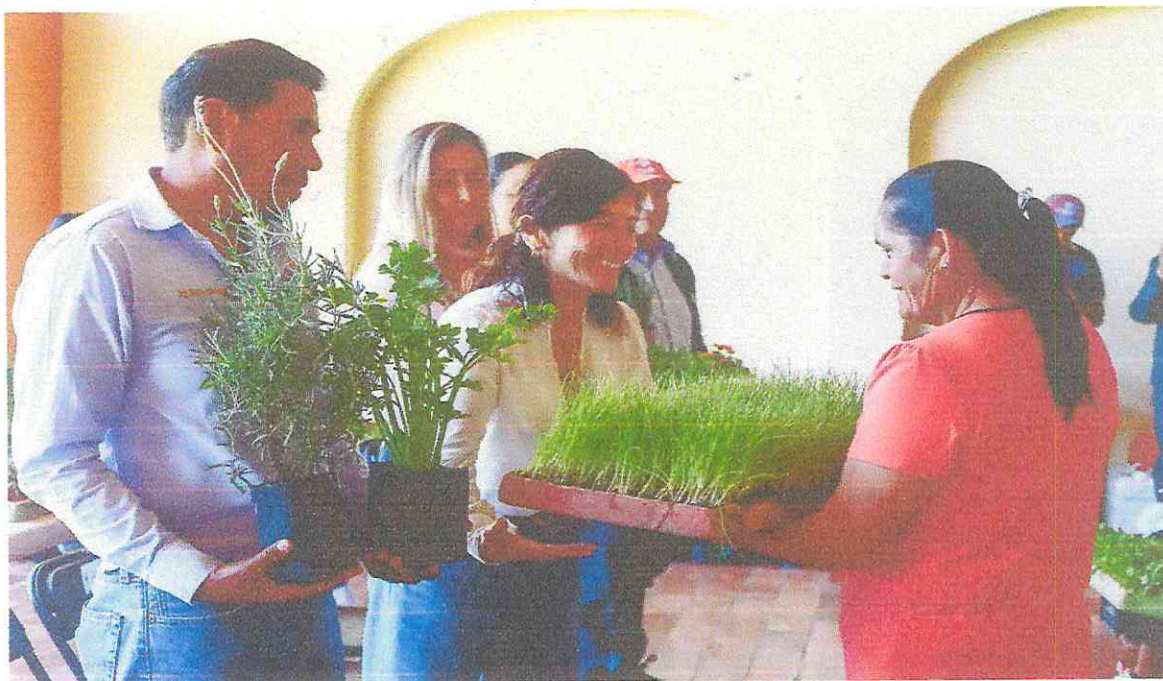
ENTREGA DE PLANTULA POR PARTE DE LA PRESIDENTA MUNICIPAL Y DIRECTOR DE DESARROLLO AGROPECUARIO.