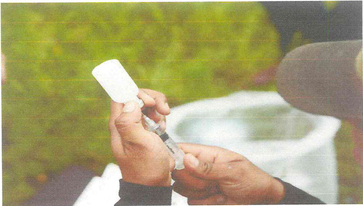
PREPARACION DE LA VACUNA POR LOS MEDICOS VETERINARIOS.