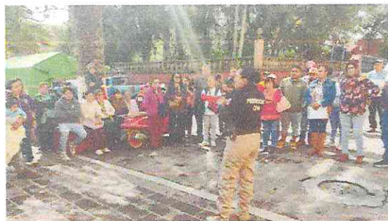
CAPACITACION A COMERCIANTES POR PROTECCION CIVIL