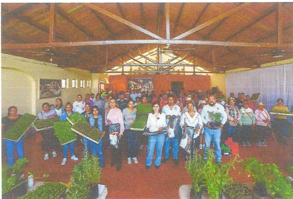
ESCUELAS DE CAMPO DEL MUNICIPIO DE HUICHAPAN PRESENTES EN LA ENTREGA DE PLANTULAS PARA LAS PRODUCTORAS COMUNITARIAS.