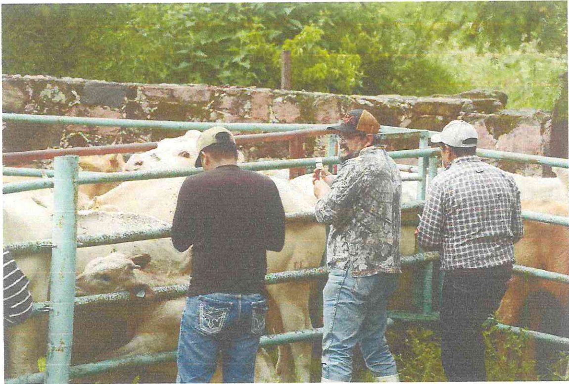
CAMPAÑA DE VACUNACION BOVINA EN EL MUNICIPIO DE HUICHAPAN.