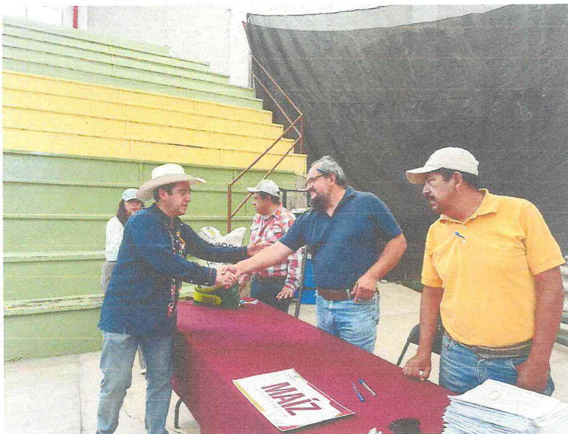
EL SECRETARIO DE AGRICULTURA SALUDANDO A LOS COMPAÑEROS DE DESARROLLO AGROPECUARIO.